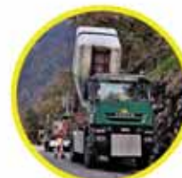
Veicolo 4x4 largh. 2.30 mt, con imbuto, betoniera o gru