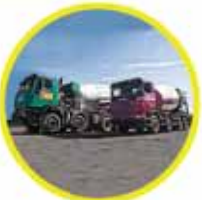
Betoniere 4 assi