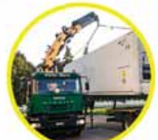
Gru varie altezze